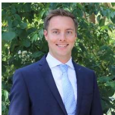
Jefe comercial / Oficial autorizado