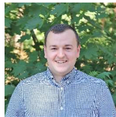
Office Manager Servicio comercial