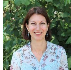
Asistente de dirección